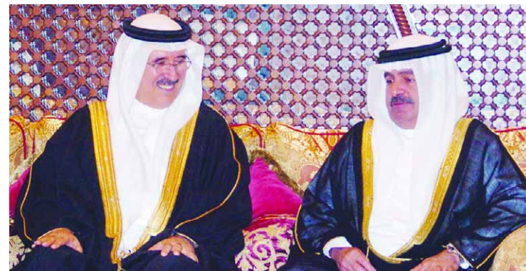
سمو الشيخ علي بن خليفة آل خليفة مستقبلاً عائلة الكوهجي

وقال: إنني أهنئ أيضاً الشعب السعودي والأمة العربية والإسلامية في مناسبة مرور 5 سنوات على مبايعة خادم الحرمين الشريفين الملك عبدالله بن عبدالعزيز لتولي مقاليد الحكم ملكاً للمملكة العربية السعودية - أنه يشرف بأن يرفع لقامه السامي أسمي آيات التهانى والتبريكات ساللاً الله عز وجل أن يطيل في عمره ويديم عليه الصحة والعافية.