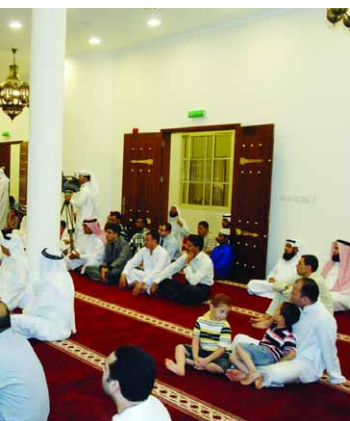
عدد من الحضور