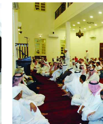
عدد من الحضور

الجمعة مساحتها 149 متراً مربعاً ويتسع لنحو 400 مصلي، فضلاً عن مصلى خاص بالسيدات تبلغ مساحته نحو 40 متراً مربعاً. ويحتوي الجامع على كافة المرافق والخدمات اللازمة من دورات مياه وأماكن للوضوء وسكن خاص بإمام الجامع، إضافة إلى مركز لتحفيظ القرآن الكريم، ومنارة يقدر ارتفاعها نحو 35 متراً. الجدير ذكره أن جامع بن درياس البنعلي تأسس على يد المفسر له بإذن الله تعالى "محمد بن درياس بن نصر البنعلي" منذ أكثر من 200 سنة ميلادية. وتم تجديد الجامع في عام 1954 إلى أن تم هدمه عام 2007 من أجل إعادة بنائه بناءً على توجيهات صاحب السمو الملكي رئيس الوزراء أثناء زيارة سموه لوقع الجامع حيث وجه إلى مباشرة البناء بما يتوافق والمتطلبات الحديثة. ووضعت إدارة الأوقاف السنية حجر الأساس لجامع بن درياس في مارس 2009. تنفيذاً لتوجيهات سموه الذي أمر بفتح طرق تسهل الوصول للجامع مع استملاك بعض البيوت القديمة القريبة منه من أجل توسعة الجامع وإنشاء مداخل ومخارج المنطقة المحيطة بالجامع بالتعاون مع الجهات المعنية.