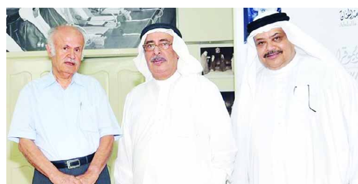
نائب رئيس الوزراء خلال زيارته بيت البحرين

استعرض نائب رئيس مجلس الوزراء سمو الشيخ علي بن خليفة آل خليفة مع سفير جمهورية الصين الشعبية لدى مملكة البحرين ياغ وي قواد علاقات الصداقة والتعاون القائمة بين مملكة البحرين وجمهورية الصين الشعبية وما ينهده التعاون بينهما من مستوى متطور على مختلف الأصعدة. وكان سموه استقبال سفير الصين بمكتبه صباح أمس. كما استقبل نائب رئيس مجلس الوزراء عدداً من أفراد عائلة الكوهجي، وذلك للسلام على سموه. ورحب سموه بأفراد عائلة الكوهجي، مشيداً بمساهماتهم في إثراء الحركة التجارية والاستثمارية في البحرين مع بقية العوائل التجارية البحرينية وفي إبراز ورفع اسم البحرين في المحافل التجارية. كما تم خلال اللقاء تبادل الأحاديث الودية حول الموضوعات المتصلة بالشان المحلي التجاري.