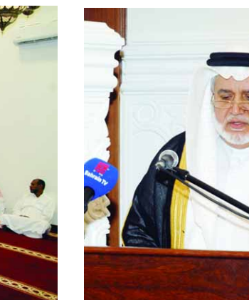
عدد من الحضور