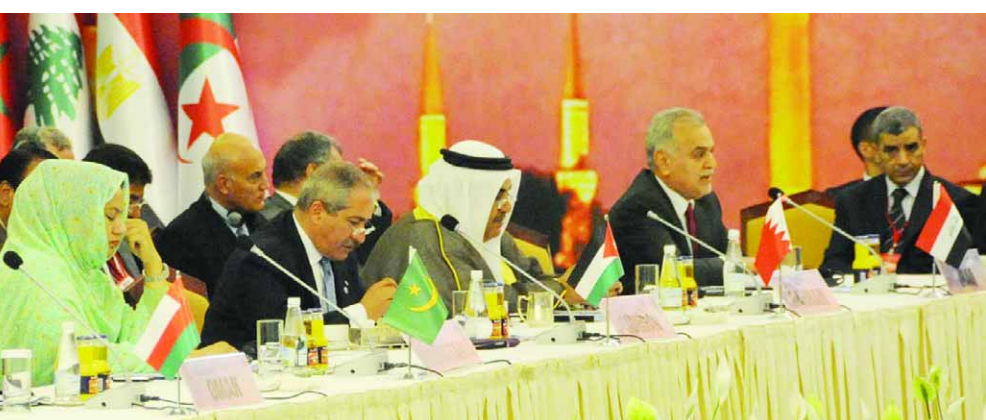
وزير الخارجية خلال اجتماع وزراء الخارجية العرب

إطاراً لعلاقات أكثر اتساعاً وشمولاً وعمقاً بين الدول العربية وجمهورية تركيا ويساعد على تطوير التعاون الاقتصادي ودعم التجارة البينية وتشجيع الاستثمارات بين الدول العربية وتركيا، وكذلك التنسيق حول القضايا الدولية والإقليمية ذات الاهتمام المشترك. كما أن المنتدى يشجع التشاور والتعاون في كافة المجالات السياسية والاقتصادية مما يشكل حجر الزاوية في تطوير العلاقات العربية التركية تحقيقاً للأهداف الاقتصادية والتنمية المستدامة.